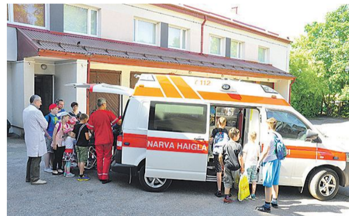
Очень интересно все, что неизвестно!

ведут постоянную очень полезную деятельность, которая вообще-то не входит в их прямую обязанность. Они обучают разновозрастное население Нарвы основам неотложной помощи, простым правилам, которые могут спасти жизнь пострадавшим, будущи оказанные еще до приезда медиков.