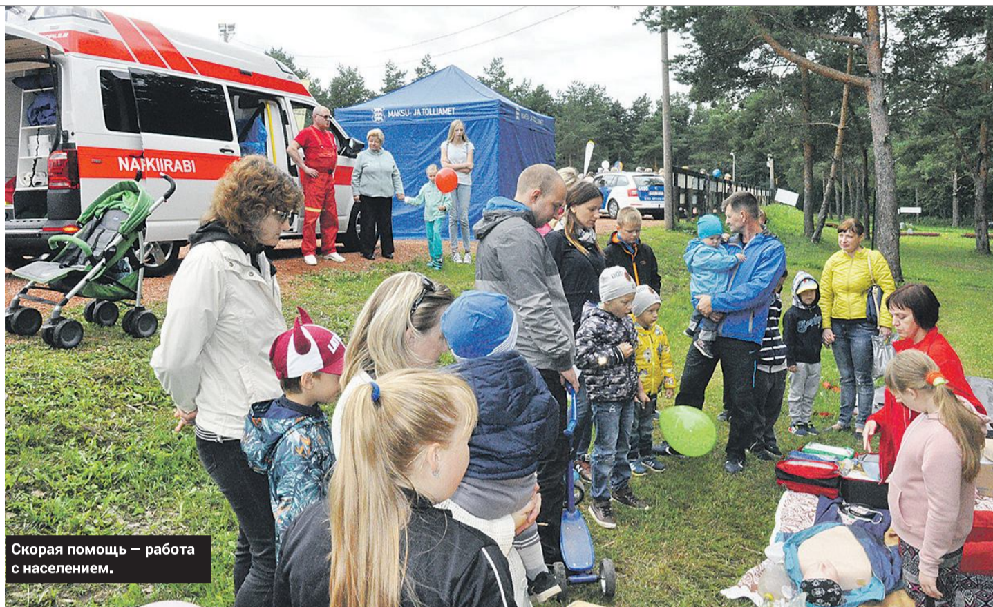
Скорая помощь – работа с населением.