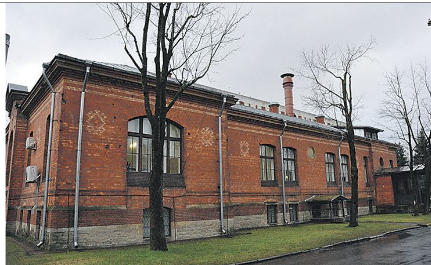
▲ Основная часть лаборатории Нарвской больницы расположена в историческом здании по адресу Хайгла 3.