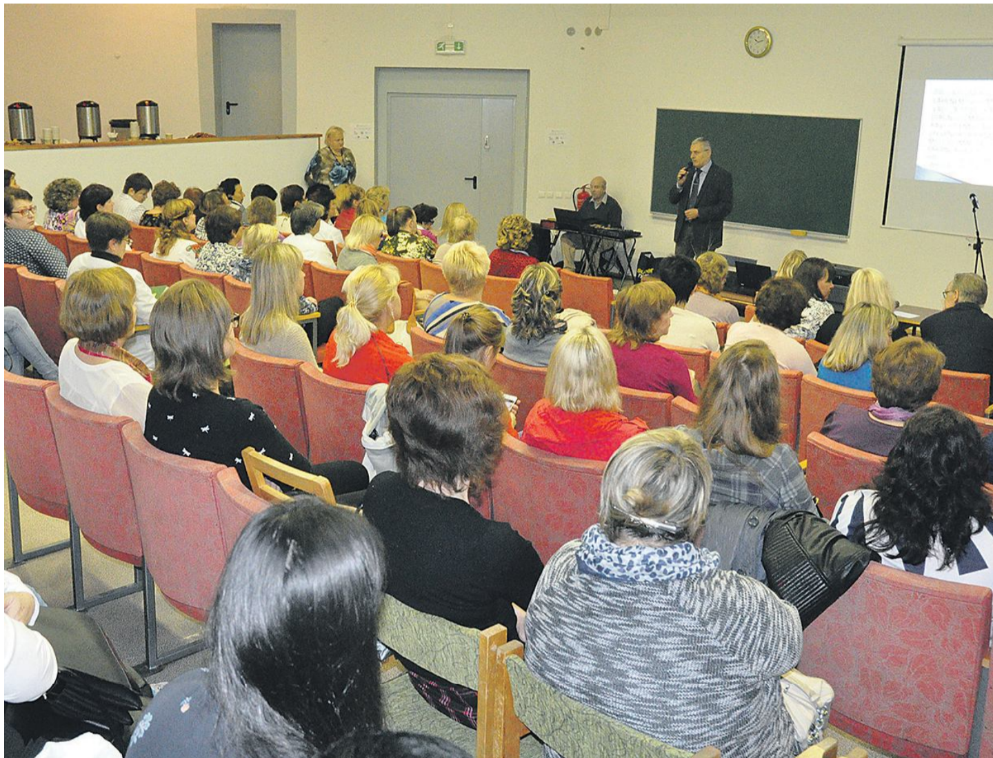
▲ Момент работы VII Нарвской международной конференции по хоспису

Напомним, что паллиативное лечение и хосписная услуга – эти два понятия, очень тесно связанных друг с другом. Паллиативное лечение сосредотачивается на уменьшении физических и